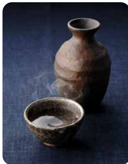
Ateliers températures de service