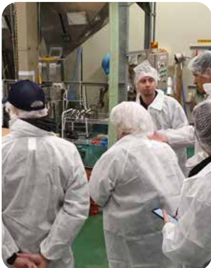
Visite d'une sakagura moderne