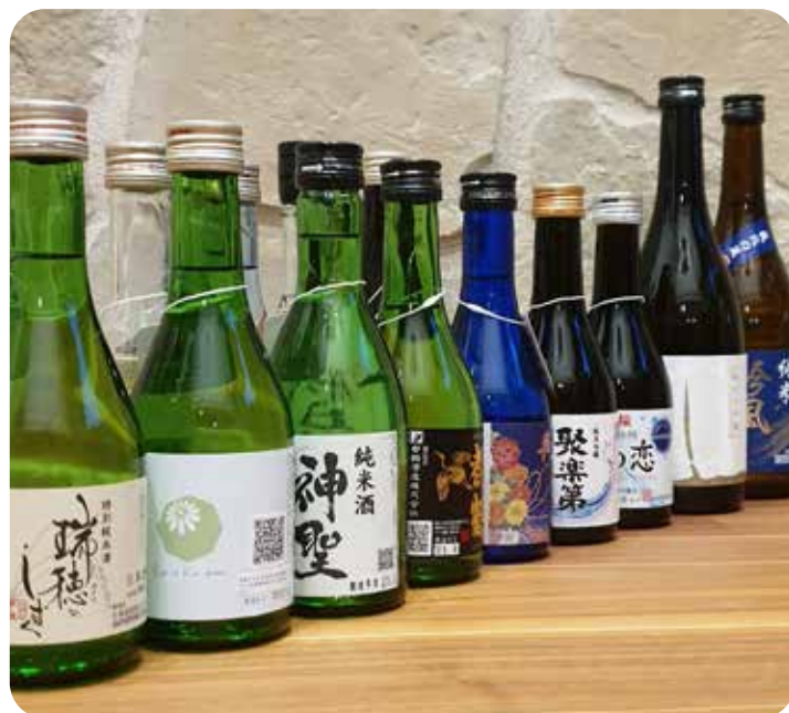
Atelier dégustations à l'aveugle

24 sakés sont dégustés au cours de ces ateliers pratiques.