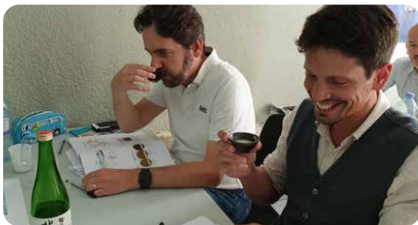
Dégustations lors d'une formation saké, Lyon 2019

Si le discours est résolument tourné professionnels via notamment les techniques de service, de composition de carte et de dégustation, les particuliers qui souhaitent découvrir le saké ne sont pas délaissés et ont accès à la totalité de la formation. Vous prendrez plaisir à participer aux modules théoriques tout comme aux ateliers pratiques «accords mets / sakés» ou «dégustation à l'aveugle».