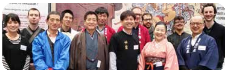
La team Ultimate Sake en compagnie de partenaires

Heureusement, nous ne sommes pas seuls : soutenus par de nombreux acteurs du marché au Japon et par les personnes que nous avons formés en France, nous avons travaillé pour élaborer le contenu de formation le plus complet à ce jour sur le saké.