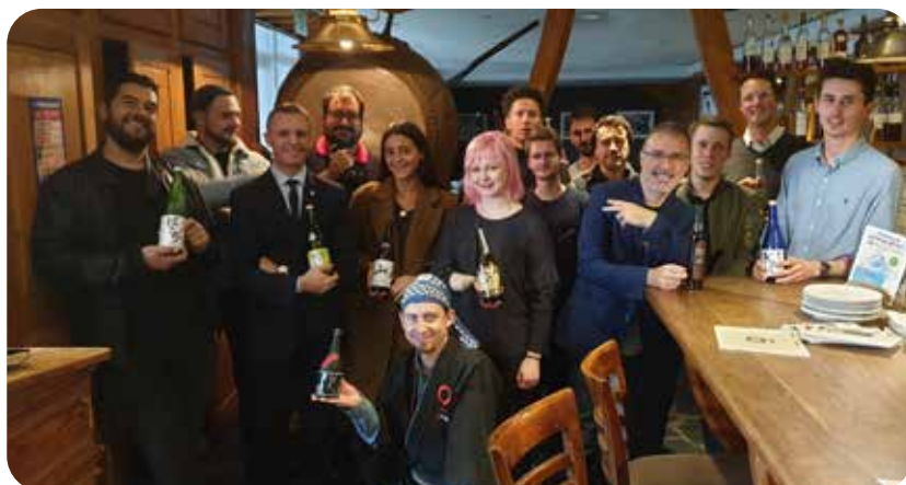
Formation saké - Paris 2019