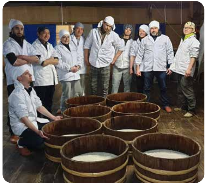
Travail quotidien dans la sakagura, en compagnie des kurabito

+ Repas avec le personnel et hébergement au sein des sakagura (brasseries à saké) pour des discussions informelles en direct avec les producteurs !