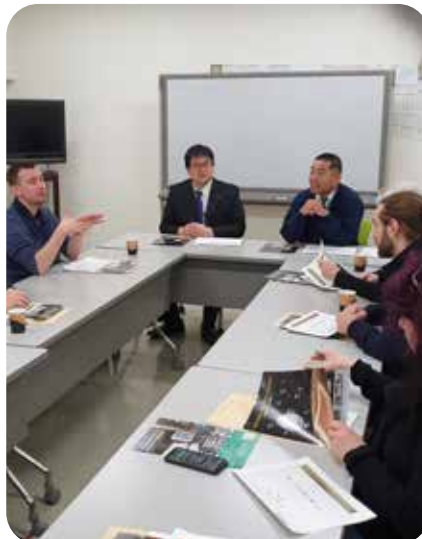
Des rendez vous avec des acteurs du marché du saké. Ici, une usine de polissage du riz.