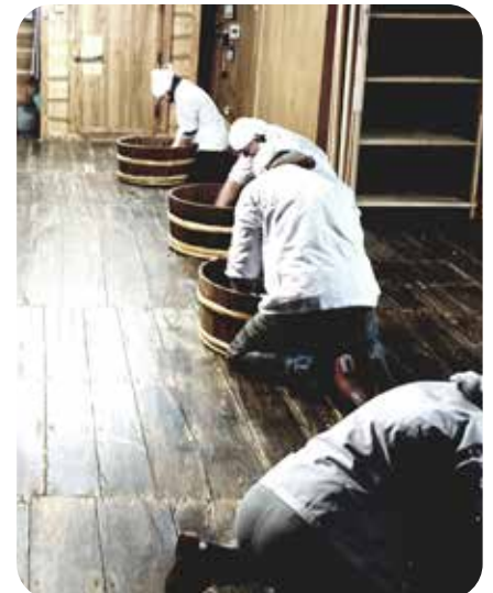
Vous n'échapperez pas au travail de brassage.