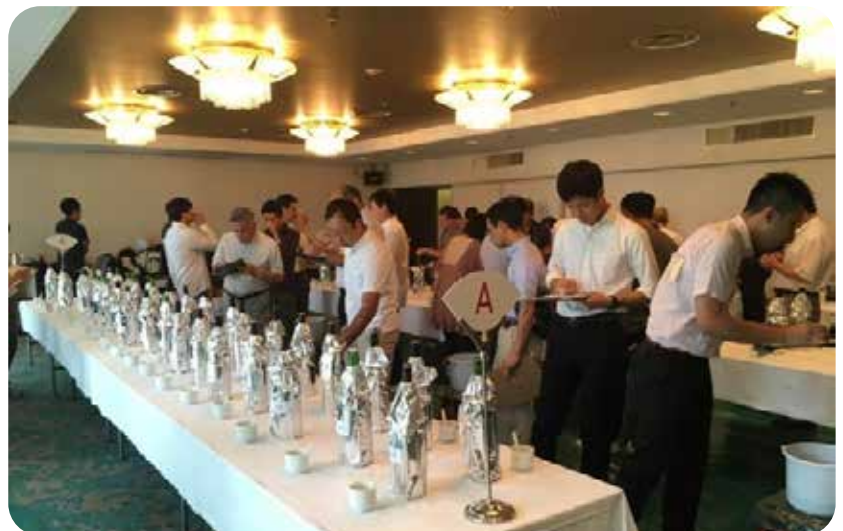
Atelier pratique - Kuramoto Kyôryûkai

ci contre : la Kuramoto Kyôryûkai édite régulièrement des livres sur le thème du saké.